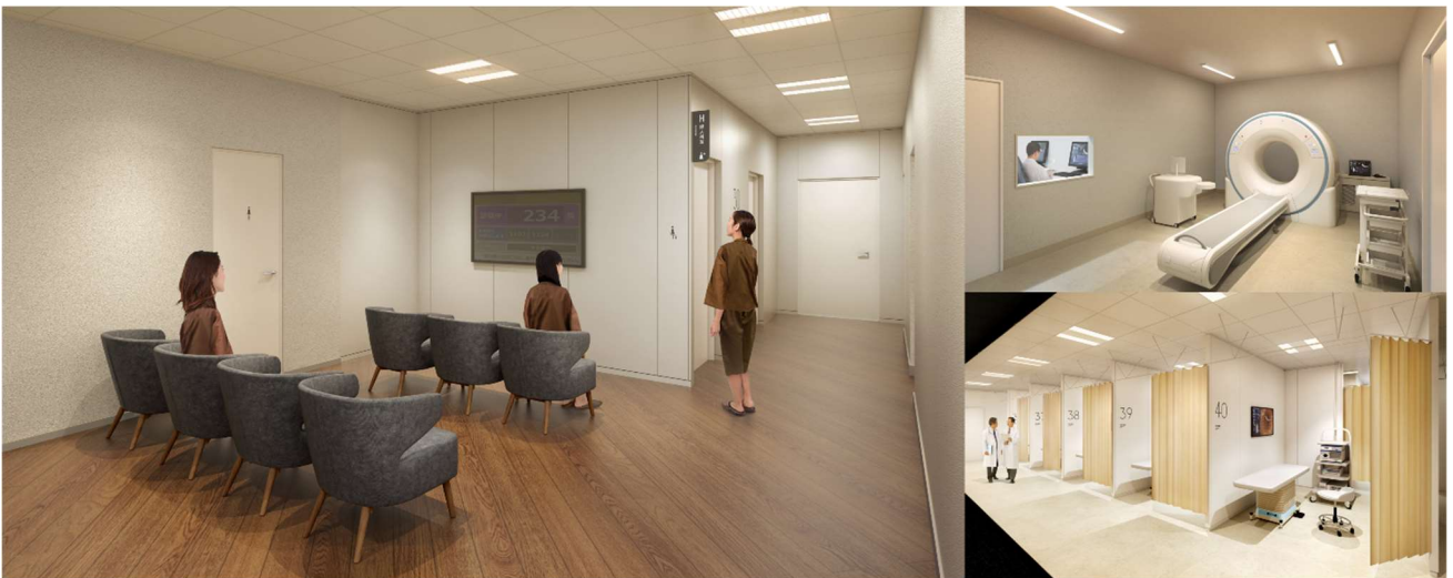
混雑状況把握・誘導支援システムや AI 活用による CT・内視鏡検査スペースイメージ

そして、健康診断において最も重要な検査の精度に関しても、AI 技術の積極活用により更なる向上を図ります。従来通り豊富な臨床経験を持つ医師・技師が検査にあたるのは勿論のこと、胸部 X 線で導入している AI 技術を活用した画像診断支援ソリューションを CT にも導入。「小さな異変も見逃さない」検査を目指します。