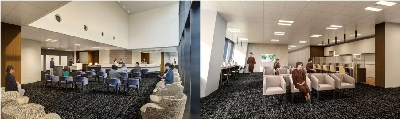
受付・中待合スペースイメージ

また、DX（デジタルトランスフォーメーション）により自動で混雑状況を把握し、空いている検査へのご案内する誘導支援システムを導入。受付でお渡しするタブレット端末に、最短で受診できる検査をお知らせし、待ち時間の短縮に繋げることで、ストレスの少ない健康診断を実現します。