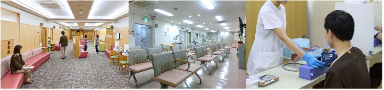
海外へ寄付した旧健診センターの家具（ロビーチェアや採血テーブル等）

当機構は、今後も県民の皆さま一人ひとりが元気で健康に自分らしく暮らしていける社会づくりに貢献できるよう、また、ふくおか健康づくり県民運動を支える中核的な団体となるよう、取り組んでまいります。